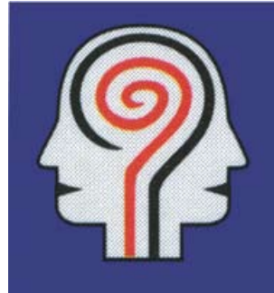
PSYCHIATRISCHER KONSILIAR & LIAISONDIENST