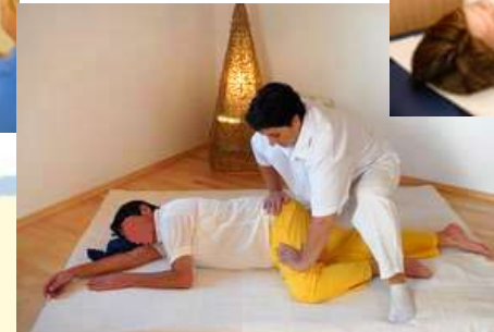
SHIATSU bringt Lebensenergie zum Fließen