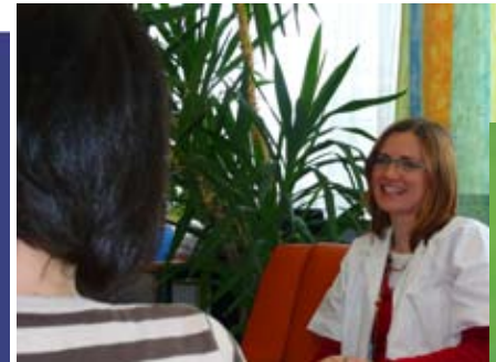
PSYCHOTHERAPIE & KLINISCHE PSYCHOLOGIE